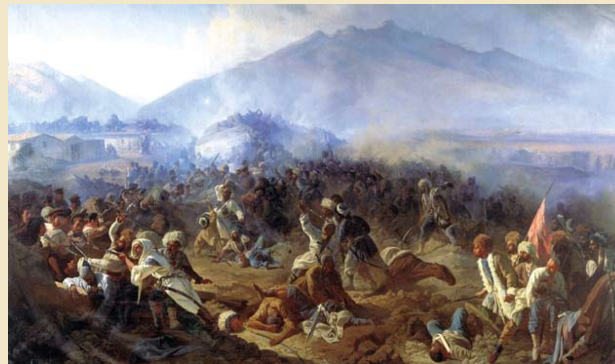
Штурм Ахты. 1848. Бабаев П.

История – тарих. Эпоха – девир. Мир – дуйнья. Земля – чил. Родина – ватан. Страна – уьлкве. Государство – гьукумат. Народ – халкъ. Люди – инсанар. Нация – миллет. Неприятель – душман. Крепость – кьеле.